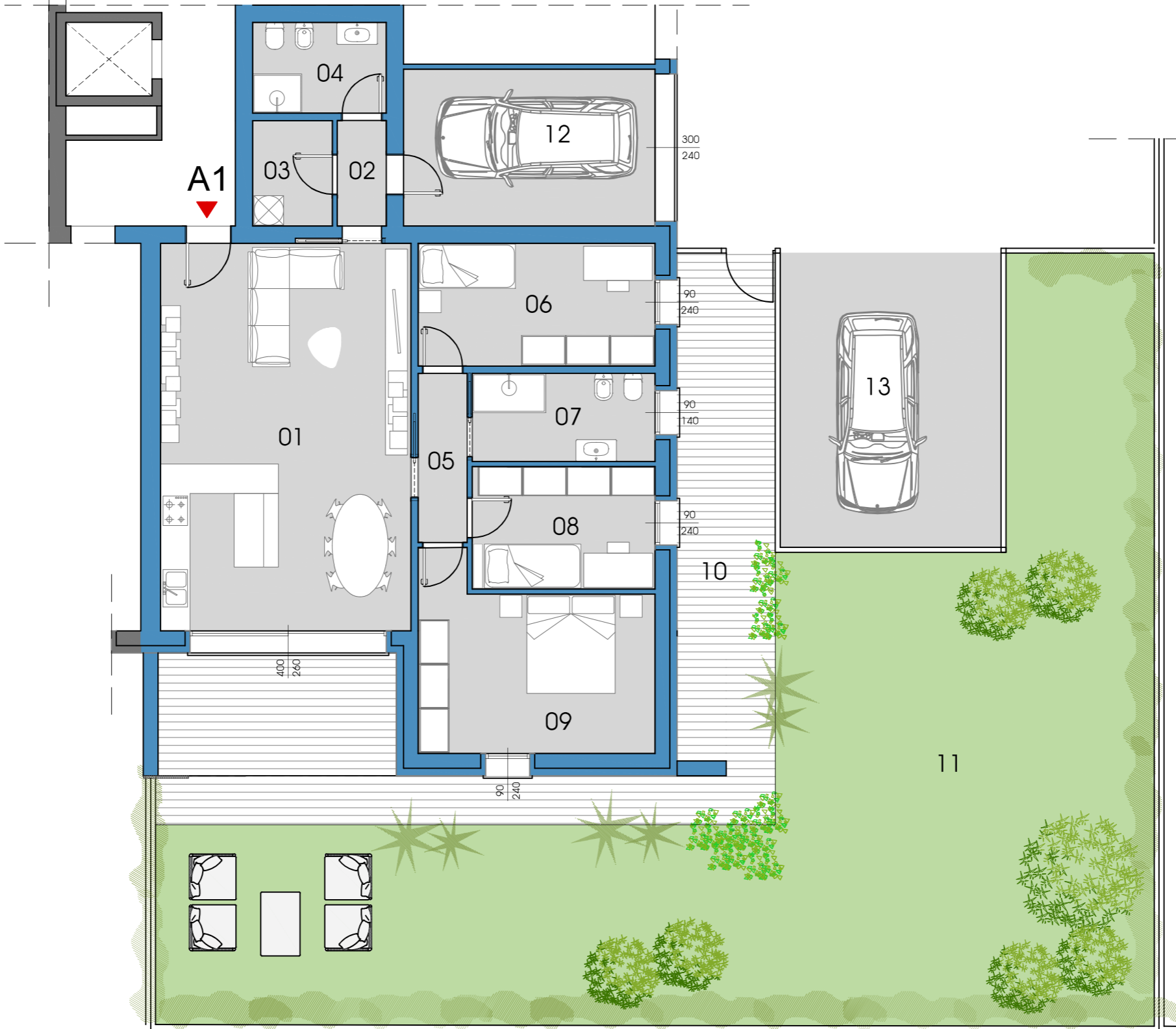
UNITÀ A1 _ PIANO TERRA